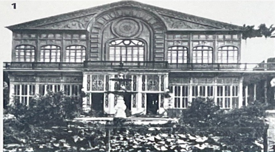
1 Restaurante del Parque Zoológico. 2 Antigua Casa de Guillón.