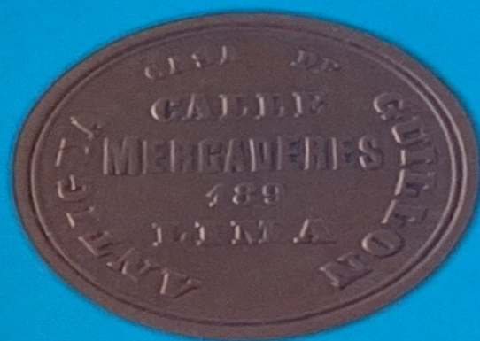
Antigua Casa de Guillón Lima - Inicios del Siglo XX

Muchos de estos establecimientos pertenecían a extranjeros y eran bastante conocidos por la sociedad limeña. Heladerías como la del italiano Capella y restaurantes como el afamado Parque Zoológico forman parte de la colección del Banco. En tiempos más cercanos, cuando en la década de 1930 se establecieron los Restaurantes Populares , estos también emitieron fichas para ordenar el servicio y brindar una mejor atención a sus comensales.