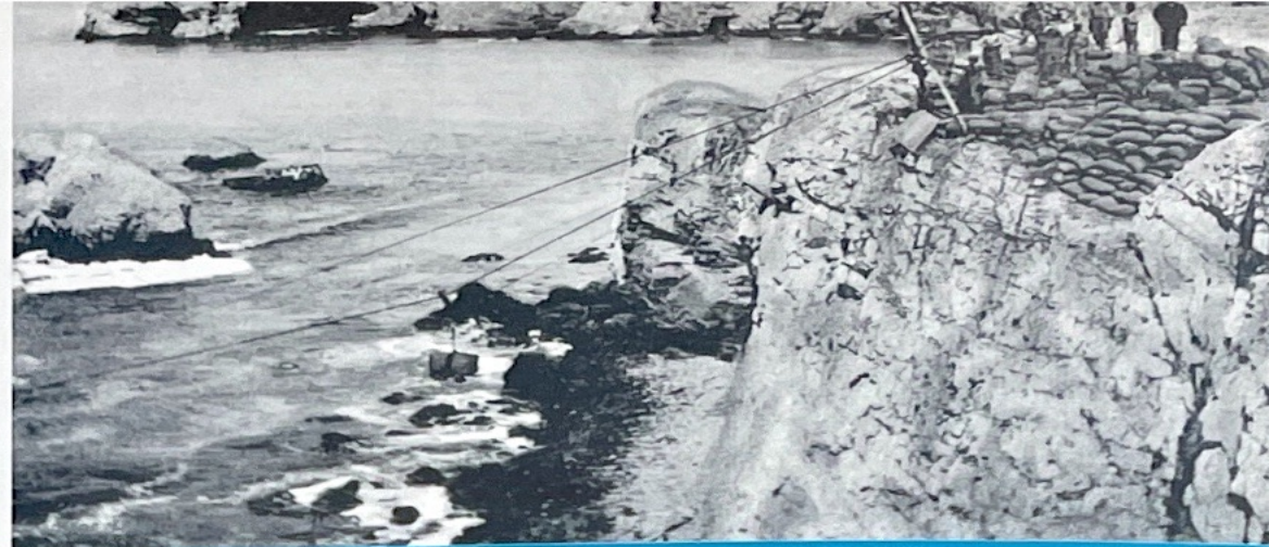
Embarcadero de guano en las Islas Chincha.