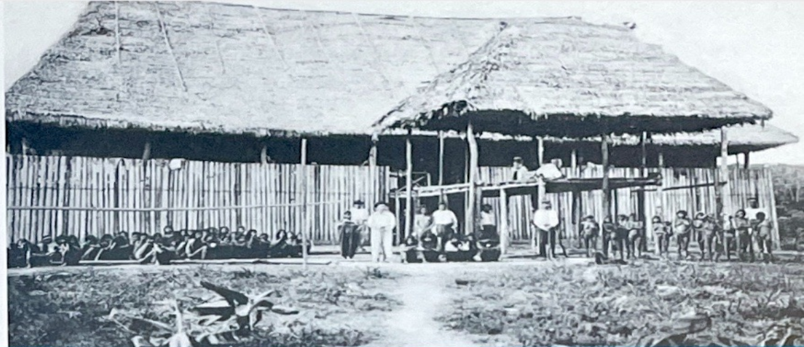
Puesto cauchero en Iquitos.