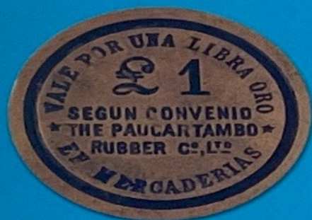
The Paucartambo Rubber Co. Madre de Dios - Inicios del Siglo XX

La Paucartambo Rubber Company emitió una serie de fichas en baquelita con sus valores expresados en libras.