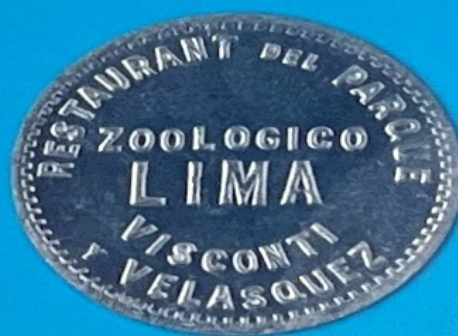
Restaurante del Parque Zoológico Lima - Inicios del Siglo XX