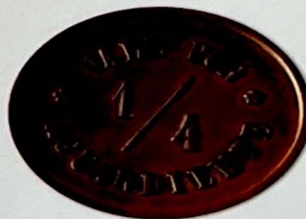
Hacienda San Gabriel Apurímac - Inicios del Siglo XX

el belga Francois Watteau en 1862 y que sumó estas fichas de bajo valor a su emisión de billetes. Otras contemporáneas fechadas son por ejemplo las de J. M. Osorio de Arequipa en 1862, las de Casimiro Dueñas de Pisco y de Juan Lapeyre del Callao en 1863.