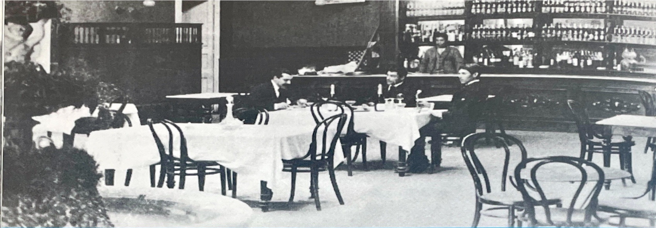
Cantina del famoso Jardín Estrasburgo.