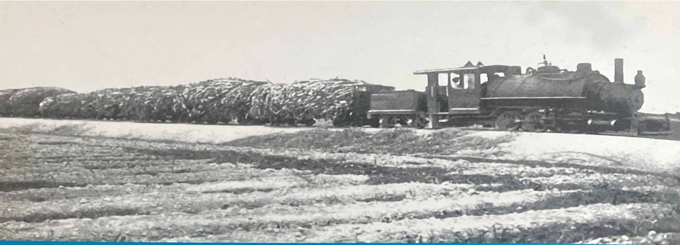
Hacienda Chiclín - Perú / Convoy de caña de azúcar.