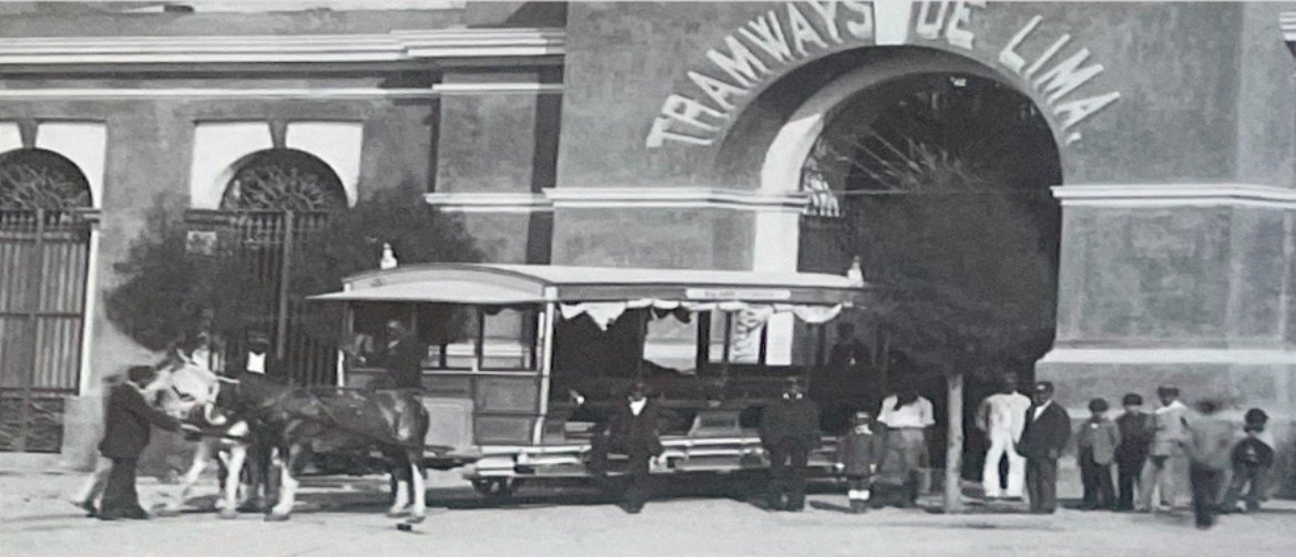
Servicio de tranvía en el Rímac.