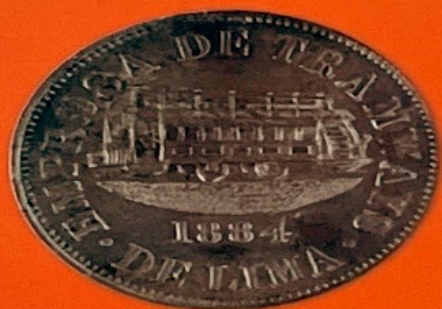
Empresa de Tramways Lima - 1884

Por otro lado, ante la continua emergencia de emporios comerciales surge una red ferroviaria compuesta por locomotoras. Así como la Empresa de Tramways de Lima mandó acuñar fichas de 25 y 50 centavos de Sol Billete, las empresas ferrocarrileras de varias ciudades de la República también pusieron en circulación para sus pasajeros, piezas de variados colores y valores.