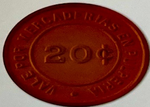
Sociedad Aurífera Andaray Arequipa - Inicios del Siglo XX