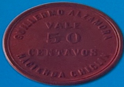
Hacienda Chiclín Trujillo - 1876

A finales del Siglo XIX y principios del Siglo XX, las condiciones económicas impulsaron el auge de la economía agraria costera. Las haciendas algodoneras fueron de mediana propiedad, pero sobre todo las haciendas azucareras se caracterizaron por la concentración de la tierra con una agricultura capitalista tipo plantación, donde se invirtió en recursos técnicos, supeditando el desarrollo del capital humano. Es decir, las pocas familias propietarias y empresas extranjeras, al igual que los gamonales nacionales del interior auspiciaron contratos de trabajo o de enganche injustos con la población indígena.