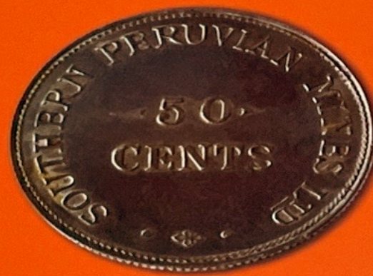
Southern Peruvian Mines Ltd. Inicios del Siglo XX

Durante el Siglo XIX la producción minera peruana se caracterizó por la extracción de la plata, sin embargo, con el cambio de siglo se inicia la etapa de la minería de los metales industriales destacando en nuestro país la minería del cobre, que se torna en un mineral que demanda el uso de avances tecnológicos y grandes capitales, creándose las plantas industriales.