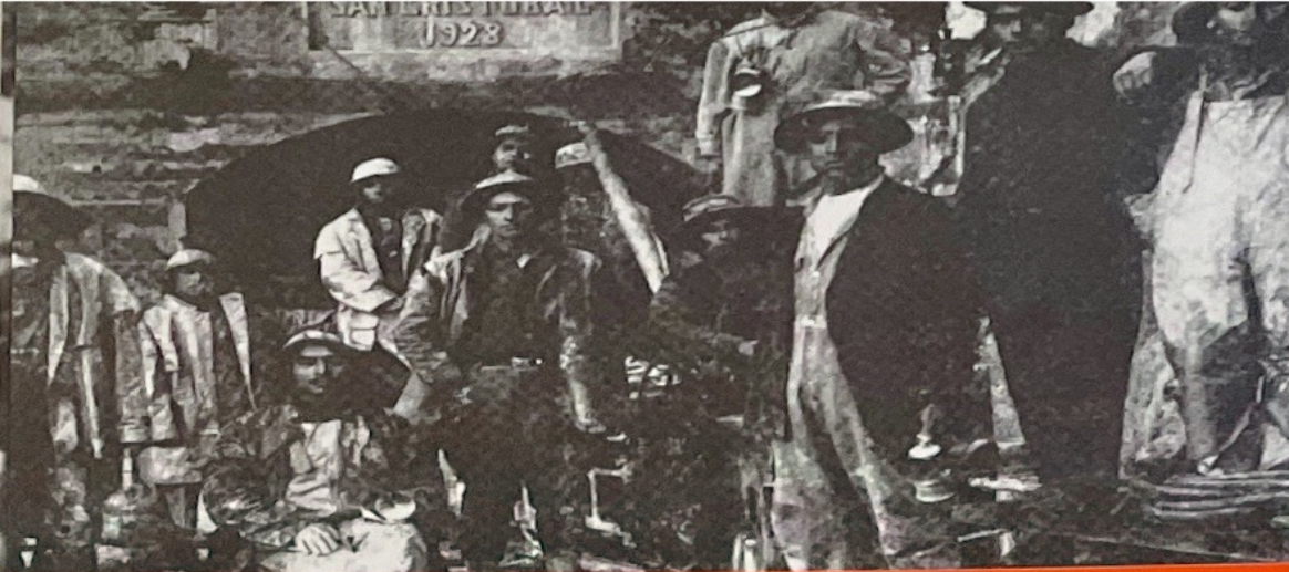
Mineros de la época.