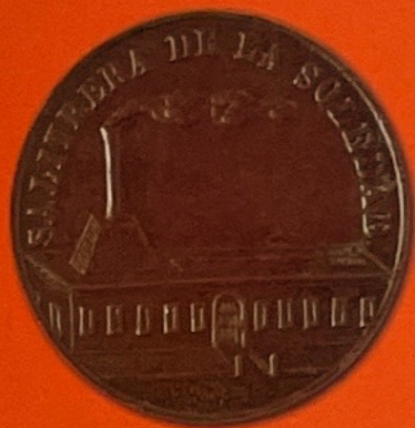
Salitrera de La Soledad

Uno de los campos que más se ha investigado entre los aficionados a las fichas es el de las fichas de salitreras. Las hay peruanas, chilenas y bolivianas, que pueden ser diferenciadas algunas veces por la unidad monetaria que utilizaban. Al coleccionista peruano le interesan sólo aquellas que quedaban en las provincias, que fueron perdidas en la guerra de 1879. Algunas, como la Mercedes tienen fichas valoradas en Una carretada de Caliche o la Tres Marías valen Una carretada .